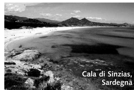
Cala di Sinzias, Sardegna

La costa nord, invece, è tutta un susseguirsi di spiagge e località balneari, prima fra tutte l'Isola Rossa.