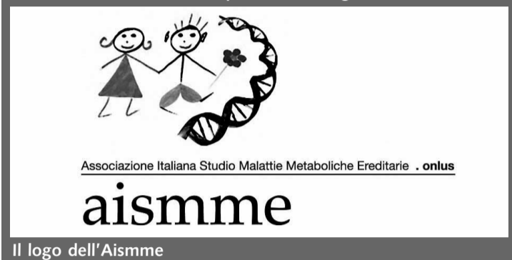
Il logo dell'Aismme

cerebrali seri e, di altrettante famiglie che, altrimenti, si troverebbero a convivere con una quotidianità difficile e piena di sacrifici.