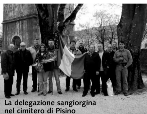
La delegazione sangiorgina nel cimitero di Pisino