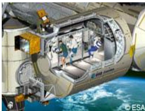
L'Interno ▲ di Columbus

"Adesso occorre aspettare sei voli shuttle" ha commentato Patti. E subito dopo ha aggiunto. "La Nasa adesso deve completare la sua sezione della Stazione e soprattutto installare i pannelli